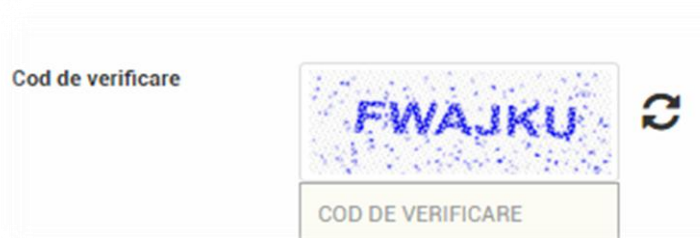
Figura 1.1. Interfața de depunere a cererii pentru reexaminarea pensiei pentru stagiul de cotizare realizat după stabilirea pensiei cu funcționalitatea „Codul de verificare”.